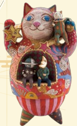
写真は歴代の日本招き猫大賞受賞作品です。