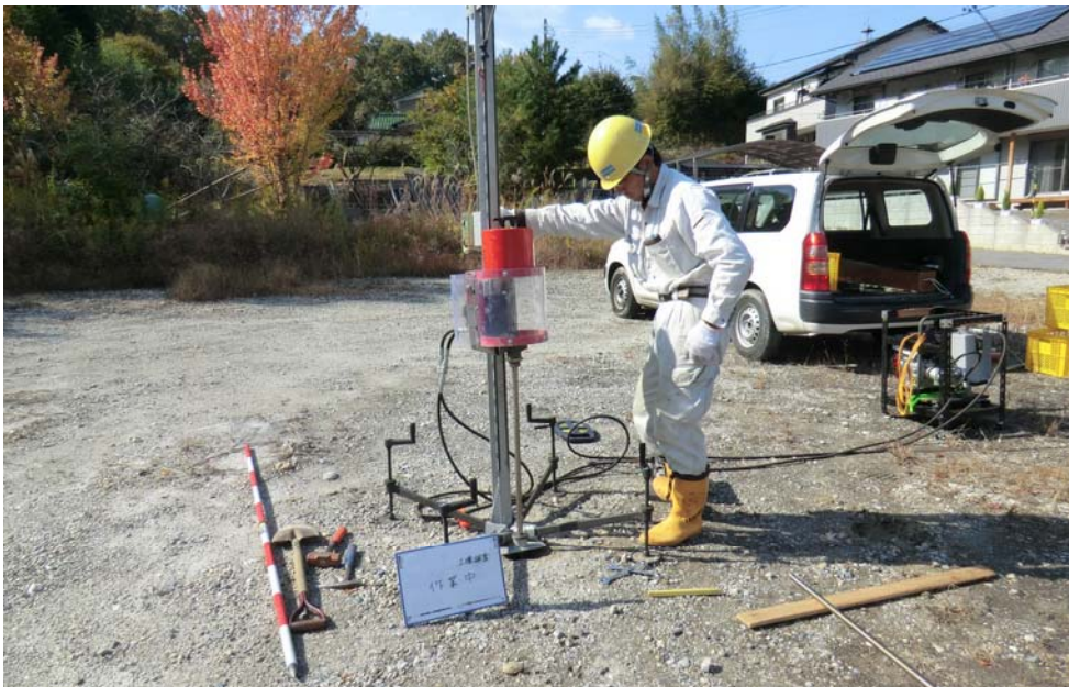
廃棄物層の層厚確認調査