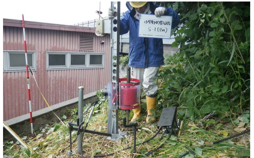
擁壁老朽化調査_基礎底盤の確認1