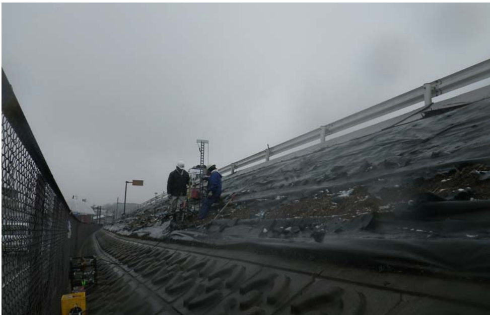
道路法尻での支持地盤確認調査1