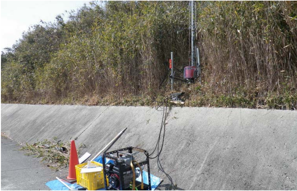
道路法尻での支持地盤確認調査3