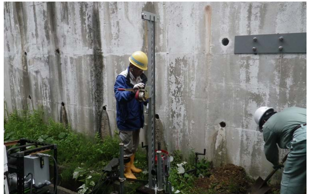
擁壁老朽化調査_基礎底盤の確認2