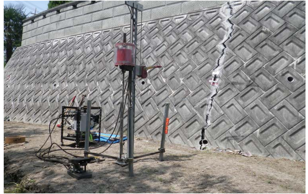
変状した宅地擁壁の調査