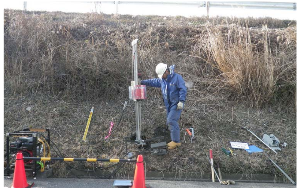
道路法尻での支持地盤確認調査2