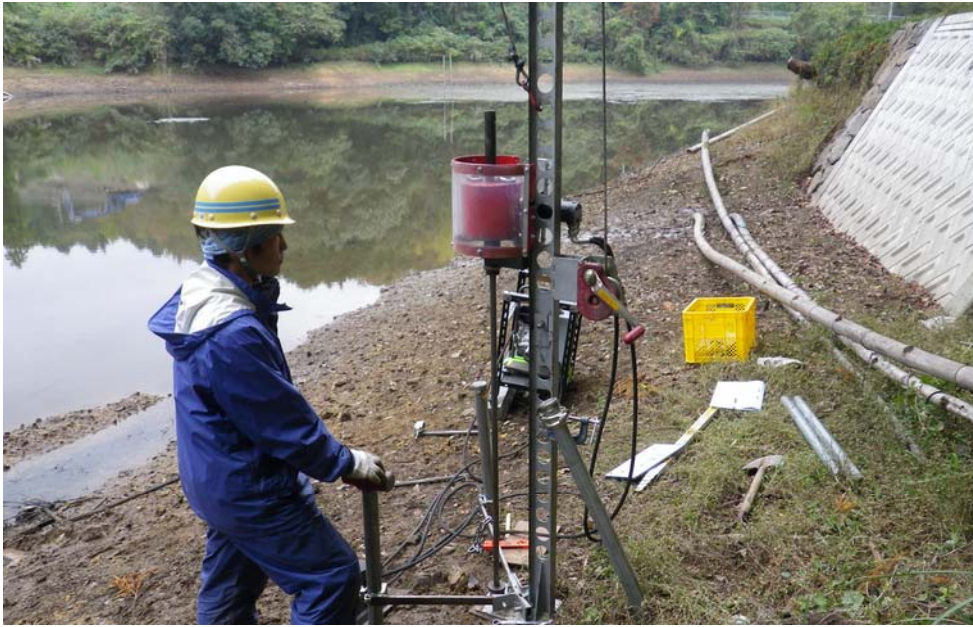
ため池堤体の調査