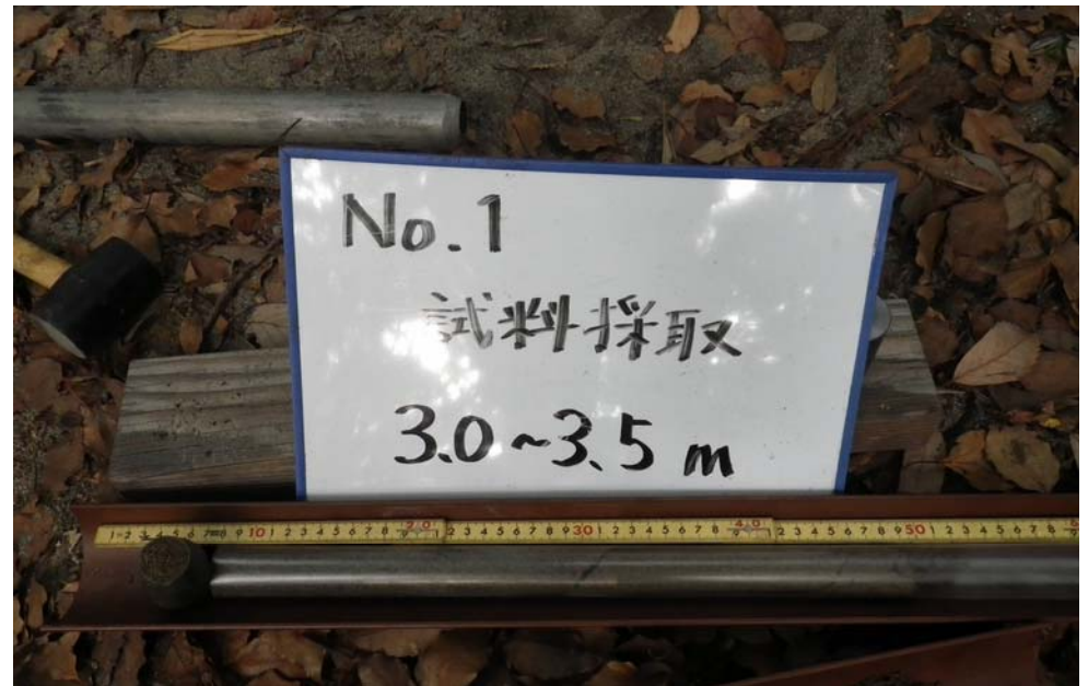
PENNYによるサンプリング2