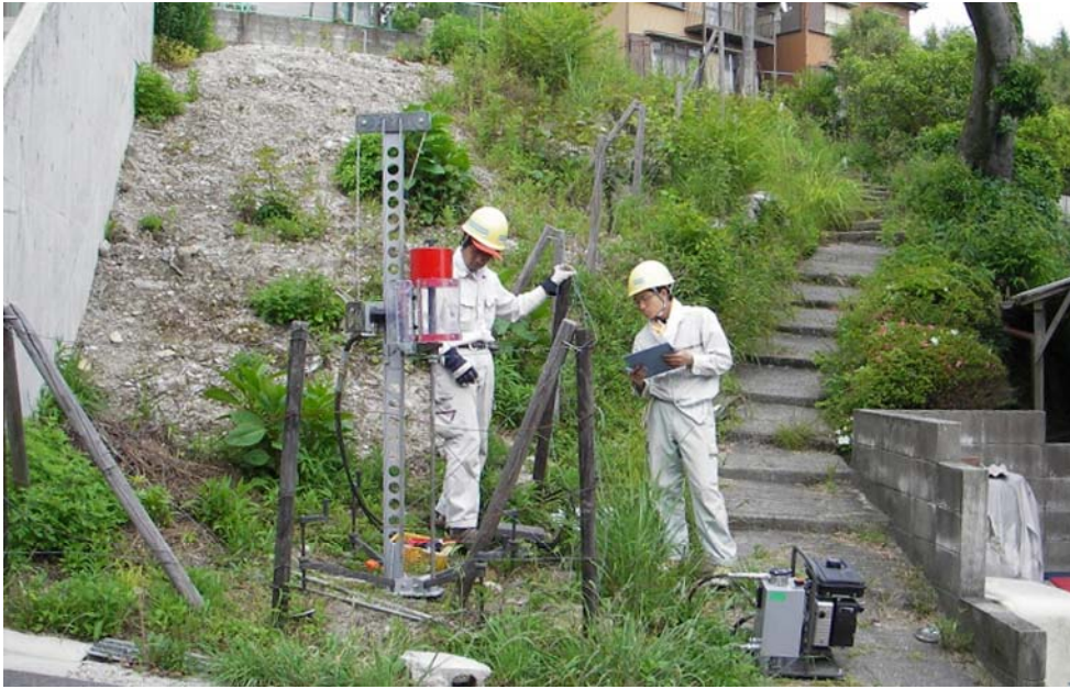
宅地地盤傾斜地での調査