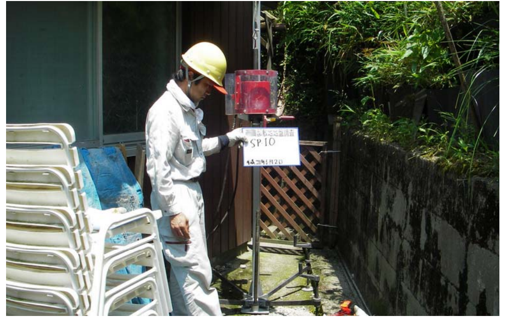
既設住宅地内での地盤調査