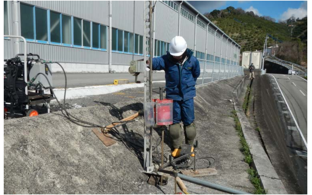
傾斜地での実施状況