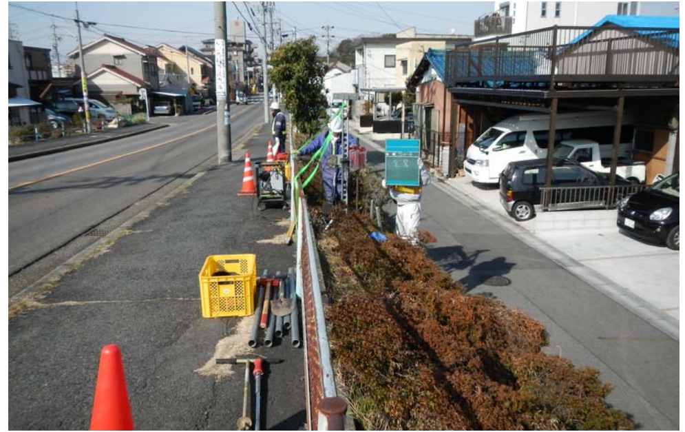
道路脇斜面での調査