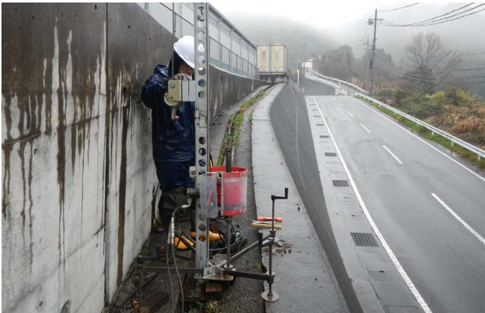
擁壁小段での実施状況