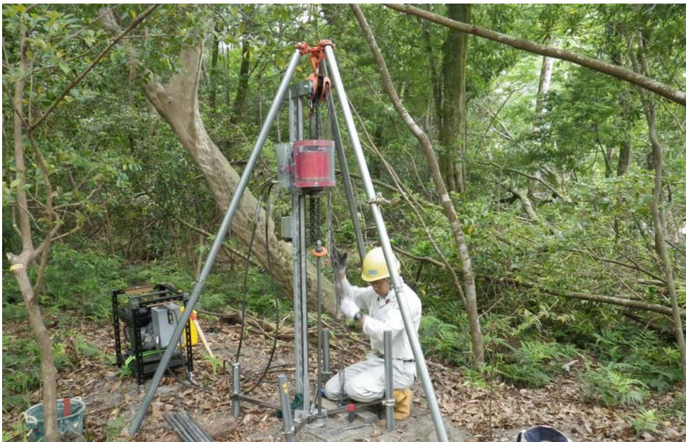
PENNYによるサンプリング1