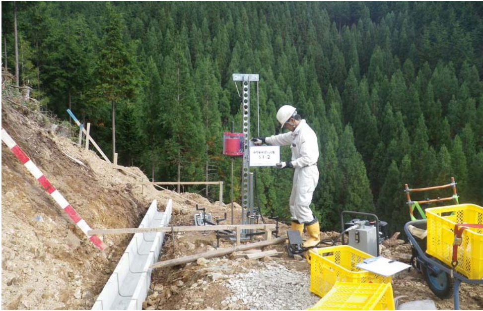
切土斜面の地盤強度の確認1