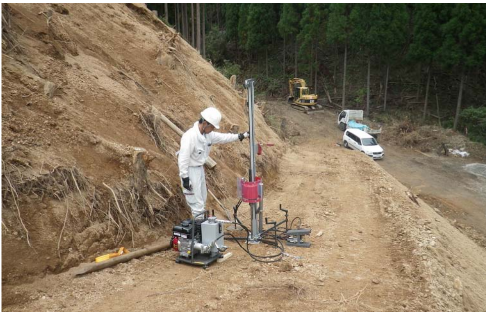
切土斜面の地盤強度の確認2